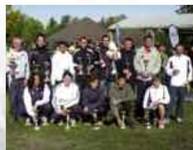
Les gagnants du Premier Semi Marathon « Des villes et des carrières »

Pour ceux qui n'avaient pas de short pour participer, nous avons quelques adresses si besoin est !