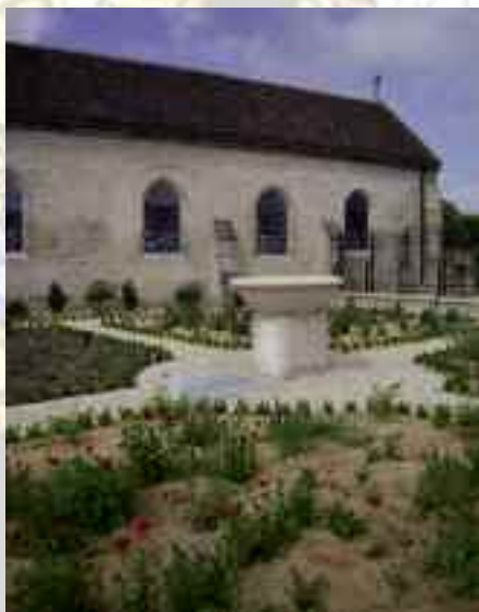
Jardin de curé

Quelques pas encore et nous voilà dans la partie potagère : tomates, carottes et poireaux sont présents. Aujourd'hui, le prêtre de St Maximin peut venir cueillir les Fleurs de ces parterres pour embellir l'Eglise lors de cérémonies