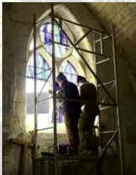
Pose des vitraux